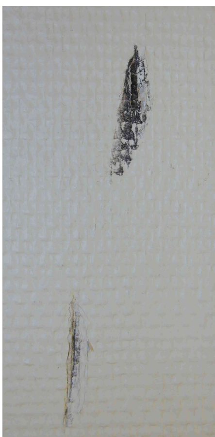
Permanenta märken på väggar

Saknar du något som fanns i lokalen? Kontakta styrelsen.